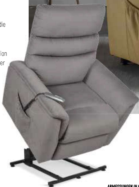
SAMT EASY CLEAN R++ (SIEHE S.2)